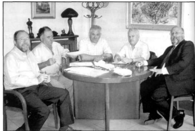
Los alcaldes de Madridejos, Camuñas, Urda, Consuegra y Turleque en la reunión, que llevaron a cabo en septiembre y en la que hicieron y firmaron las alegaciones para que el AVE pasase entre Consuegra y Madridejos.