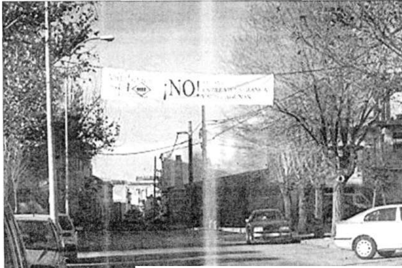
La Plataforma busca la calle para amplificar sus reivindicación!... S.

La plataforma 'Villafranca sin barreras' acordaba todos estos puntos e informaba de la gestión de la Consejería de Medio Ambiente en una reunión que mantenía el pasado fin de semana en el centro de la mujer de Villafranca donde se contó con la asistencia de representación de sendos grupos municipales, asociaciones de la localidad y de la plataforma Madridejos-Consuegra. El alcalde de Villafranca informó que en su visita a Medio Ambiente solicitó una reunión con el presidente de Cas-