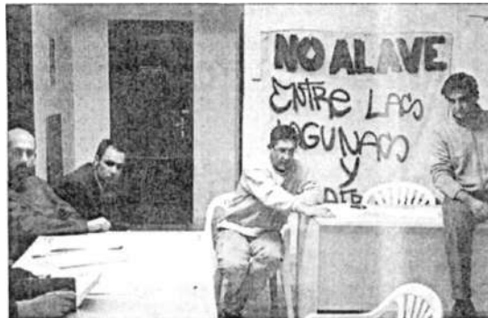
Dicen que sus motivos son económicos y medioambientales...c.