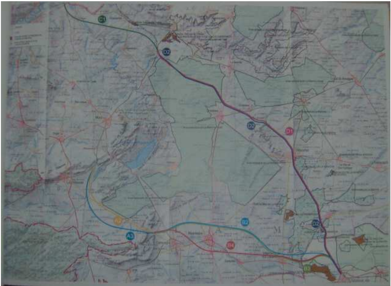
Plano del estudio informativo del tramo Mora – Alcázar.