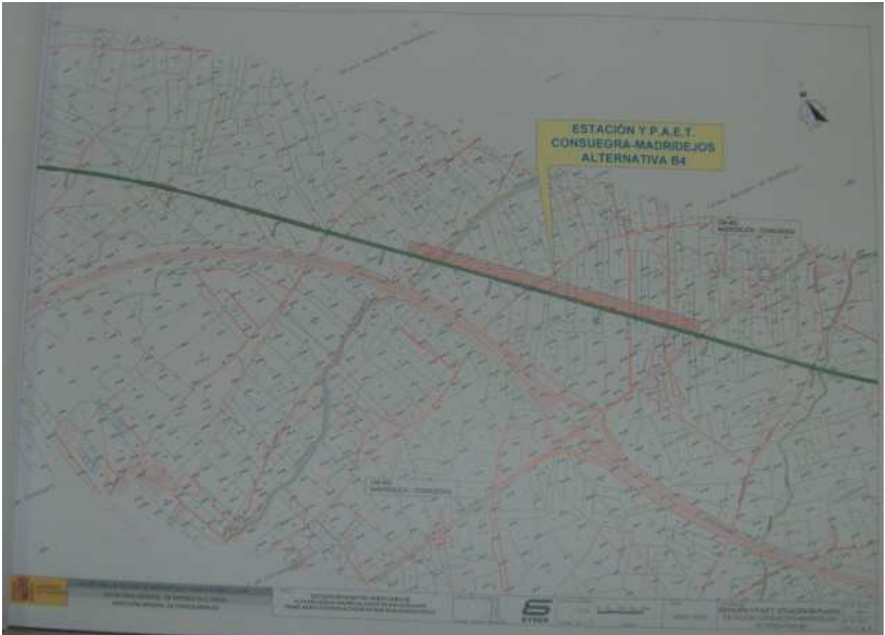
Estación y PAET "Consuegra-Madridejos", en las soluciones A2 – B4 y A3 – B4.